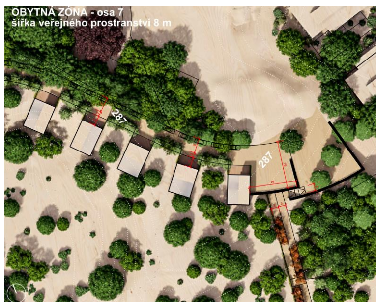
Navrhovaná zástavba osy 7 vedle parku Helgoland